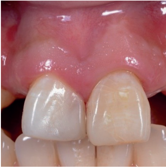
Imagen 5 Resultado final