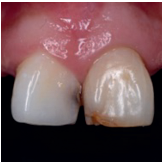
Imagen 3 Control 5 días posteriores a la aplicación de clareamiento dental interno