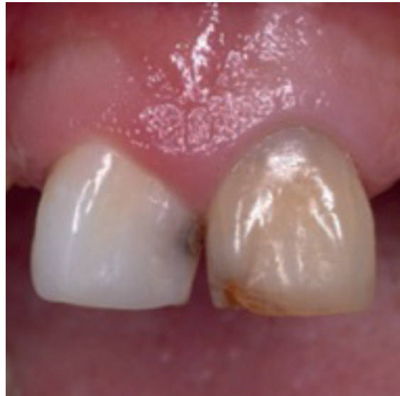
Imagen 2 Control 24h posteriores a la aplicación de clareamiento dental interno