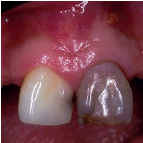
Imagen 1 Fotografía inicial